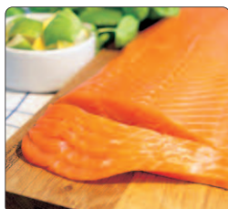
Kallrökt skivad lax, 500 g

På www.supekortprofile.se finns ett utökat produktsortiment, för de mottagare som väljer att lösa in sitt gåvokort där. Dessa produkter växlar och är aktuella under olika årstider under året.