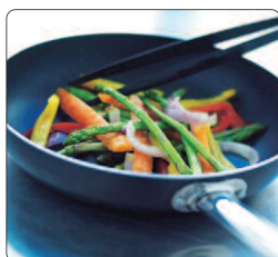
Stekpanna nonstick ø 28 cm