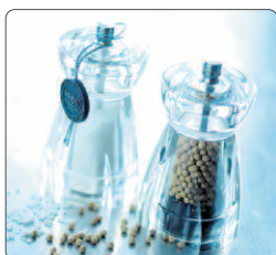
Salt & Pepparkvarn 12 cm