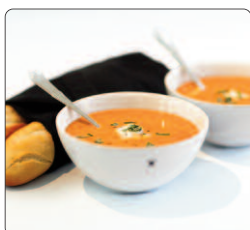
Skålar från Höganäs 2 st