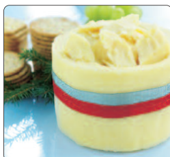
Whiskycheddar, 950 g