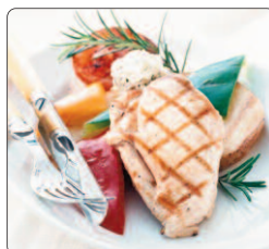
Pärlohns, 2 x 310 g