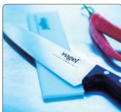
Kockkniv 20 cm