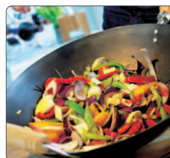
Wokpanna ø 30 cm