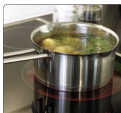
Kastrull 2 liter