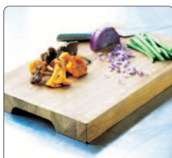
Skärbräda av ek