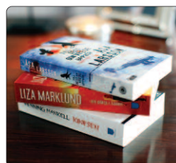
Pocketpaket 3 st böcker