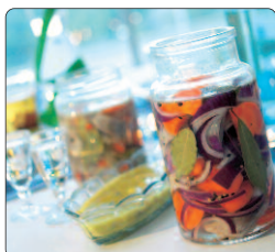
Sex sorters sill, 1600 g